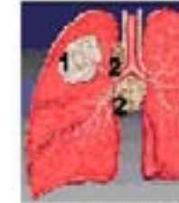
Lungenkrebs 1 = Tumor 2 = Metastasen

Medizinische Folgen: - chronischer Husten - Bronchienentzündungen - kardiovaskuläre Effekte - Herz/Kreislaufprobleme - eine Verschlechterung der Lungenfunktionswerte (vor allem bei Kindern) - Lungenkrebs und Leukämie - Verkürzung der Lebenserwartung